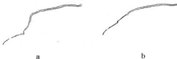
Рис. 1. Боковий переріз через чоло Cordylepherus viridis F. в місці розташування ексциаторів.