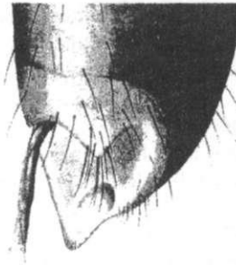
Рис. 3. Верхівка надкрила самця Clanoptilus elegans Oliv. (за D. Matthes [4]).

Для представників цього роду характерний елігтральний тип ексцигаторів (на верхівках надкрил) у вигляді вдавлення з придатками – хітиновими відростками (рис. 3).