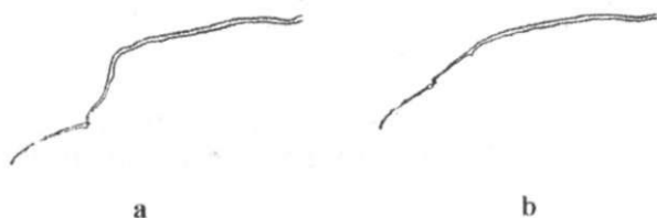
Рис. 1. Боковий переріз через чоло Cordylepherus viridis F. в місці розташування ексцигаторів.