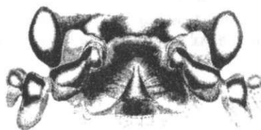
Рис. 2. Голова самця Malachius bipustulatus L. (за D. Matthes [4]).

Представники роду мають фронтальний тип розташування ексцигаторів, але, на відміну від попереднього, – у вигляді ямки з валиком посередині, на якому розміщені пучки волосків (рис. 2).