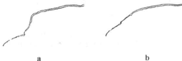
Рис. 1. Боковий переріз через чоло Cordylepherus viridis F. в місці розташування ексцигаторів.