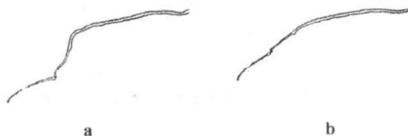
Рис. 1. Боковий переріз через чоло Cordylepherus viridis F. в місці розташування ексцигаторів.