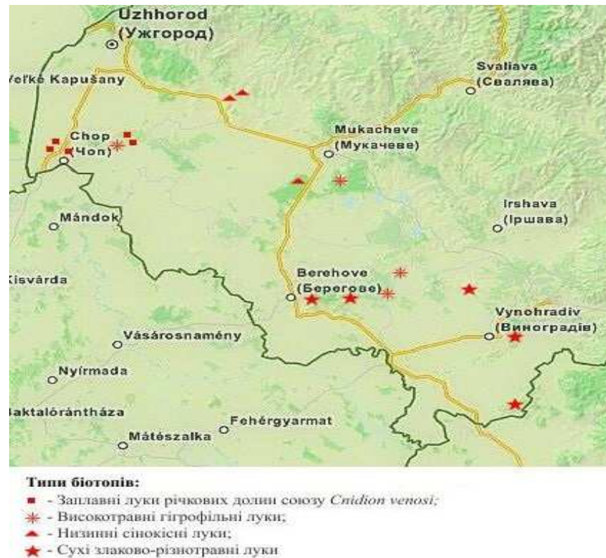
Рис.1. Точки відбору ґрунтових проб на лучних біотопах Закарпатської низовини.

Закладання та морфологічні описи ґрунтових розрізів проводили згідно методики польових досліджень ґрунтів [8]. Лабораторно-аналітичні дослідження проводили за загальноприйнятими методиками [1, 2, 6, 10]. Для класифікації ґрунтів використовували факторно-екологічний принцип, розроблений УкНДІЛГА ім. О.Н. Соколовського [8] та профільно-генетичний принцип, прийнятий для світової реферативної бази ґрунтових ресурсів [11, 13]. Дослідження кількісних та якісних показників угруповань орбіатид здійснювали у відповідності до загальноприйнятих ґрунтово-зоологічних методів [9].